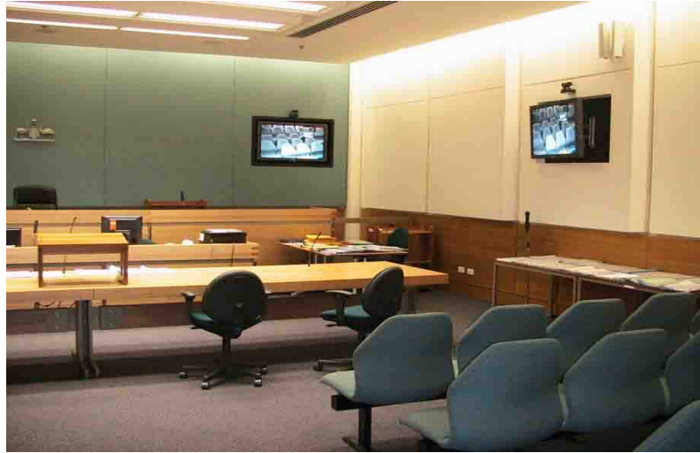
VIDEOCONFERENCE COURTROOM, Federal Court, Sidney, 2006