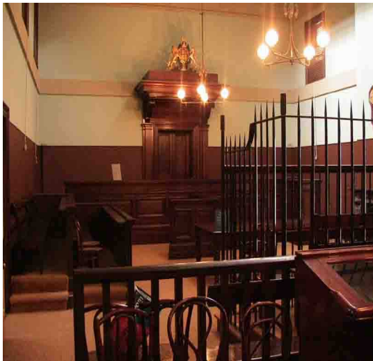
POLICE COURT, Sidney, 1886