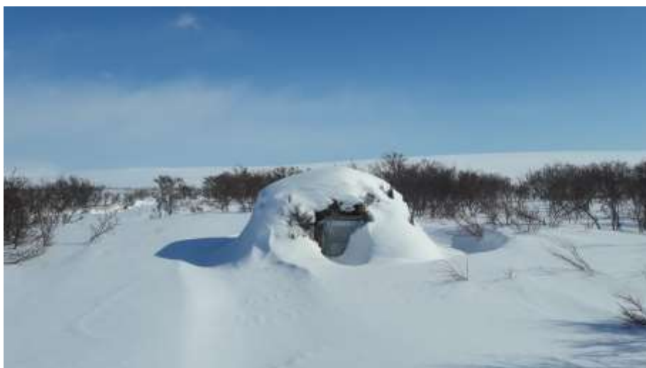
Goahti Álljeveajnjálmes, Čáhcesuolu gielddas / Gamme i Øvre Flintelvmunningen, Vadsø kommune

Meahcceduopmostuolu váldovuoruheapmi 2016s lei loahpahit buot áššiid mat bohte sisa duopmostullui. Dat lea dahkon juolluduvvon bušeahta rámaid siskkobealde. Meahcceduopmostuolu doaibmadilli lea mealgat buorránan maŋŋágo lahkaásahus § 9 nuppi láđas Finnmarkokomišuvnna ja meahcceduopmostuolu birra loahpahuuvui. Loahpaheapmi mearkkaša ahte gáibádus máksit áššegoluid mat ovddiduvvojit maŋŋá borgemánu 26.b. 2016s eai galgga máksot meahcceduopmostuolu bušeahtas, muhto galget meannuduvvot regelstivrema bokte seamma láhkai go golut friddja riekteveahkkái