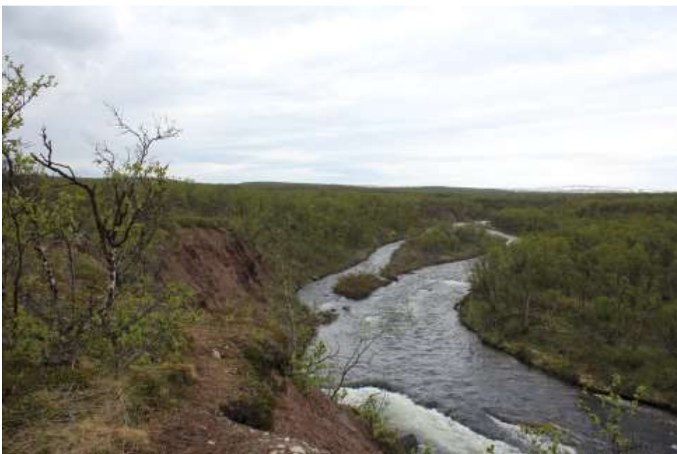
Suovvejojha, Unjárgga gielddas / Bergebyelva, Nesseby kommune.

Meahcceduopmostuolus ii leat dihto riektedáiki, ja lea danin gohčoduvvon johtti duopmostuollu. Váldodiggomat dollojit dan báikkis Finnmárkkus gos lea eanemus heivvolaš ášši ektui mii meannuduvvo.