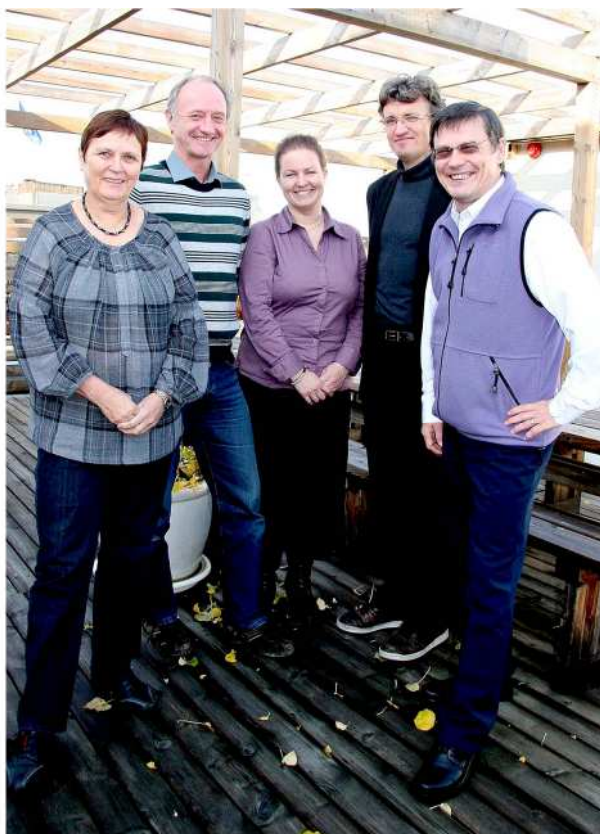
Finnmarkskommisjonens medlemmer: / Finnmárkokomišuvnna lahtut:

2011:s leat dollon gávccii komišunčoahkkima ja 62 ášši leat meannuduvvon.