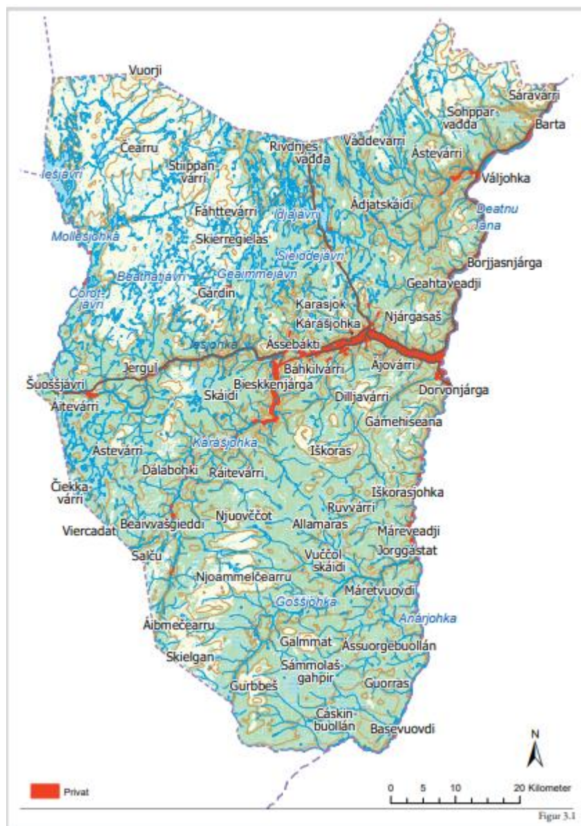
Figur 1: Kartet er kopiert fra Finnmarkskommisjonens rapport fra felt 4 Karasjok, bind 1, s. 22, og viser den grunnen i Kárášjoga gielda/Karasjok kommune som Finnmarkseiendommen (FeFo) overtok fra Statskog SF da finnmarksloven kapittel 2 trådte i kraft 1. juli 2006.

furuskog. Mesteparten av vidda ligger rundt 300 moh., med noen topper over 600 moh. Kommunens høyeste punkt Vuorji på grensen mot Porsanger, ligger på 1024 moh. Karasjok er rik på innlandsfisk, laks, fugl, vilt og multer. Det området som i dag inngår i kommunen ble underlagt dansk-norsk enejurisdiksjon i 1751. Da Norge i 1837 ble inndelt i formannskapsdistrikter inngikk Karasjok i Kistrand formannskapsdistrikt (herred). I tillegg til Karasjok, omfattet Kistrand dagens Guovdageainnu /Kautokeino, Nordkapp og Porsanger kommuner. Etter at Kautokeino ble utskilt i 1851 og Nordkapp (Kjelvik) i 1861, ble Karasjok som nevnt eget herred i 1866. I samisk sammenheng inngikk det meste av dagens Karasjok i Ávjovárrisiidaen.