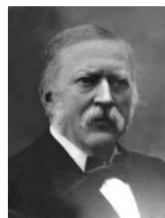
Johan Blackstad, f.1832, lagmann i Eidsivating 1889-92, lagmann i Oslo 1892-93, †1904