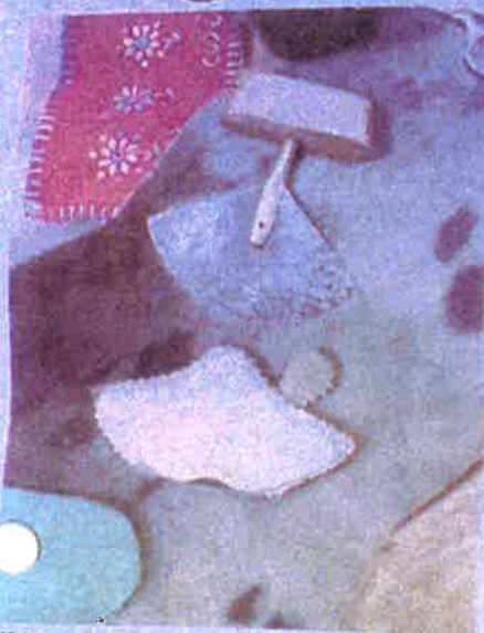
ULU: Den beste kniven til selkinnsbearbeiding er ulu, inuiternes redskap.