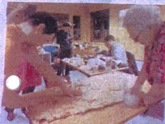
MYE ARBEID: Det skal mye til for det kraftige selkinnst blir mykt og sybart. Mestertan Mennitug deler inuiternes kunnskap.

Lyngberg ser frem til neste jaktferie med det nye selkinnutstyret sammen med selkinnmestrene han har møtt opp. Dette toket var Nordkynhøve i Tana fjorden i Canada.