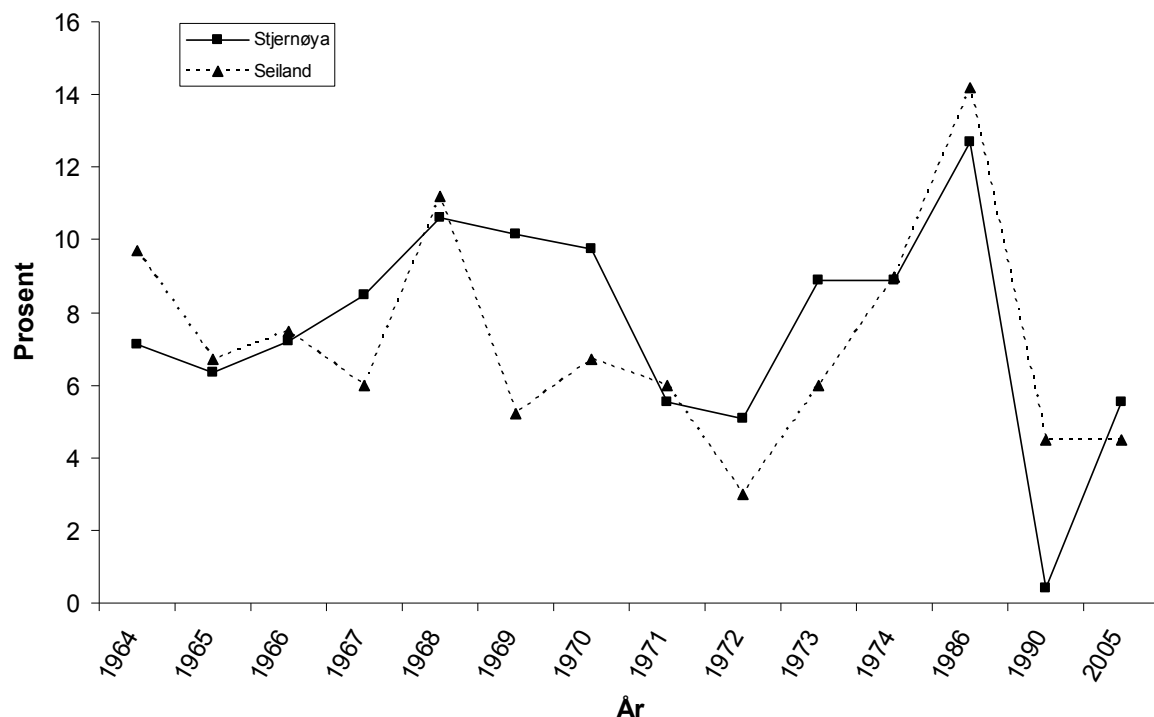
Figur 2: Prosent andel utvisninger, henholdsvis Stjernøya og Seiland, perioden 1964-2005. (Stjernøya N=253, Seiland N=134)

På grunn av kildematerialets vekslende kvalitet over tid, ønsker jeg å gå noe nærmere inn på spørsmålet om når nedgangen i utvisning skjedde. Som tidligere nevnt ble 1100 av statens sjølakseplasser fjernet i 1981, og en eventuell nedgang i utvisninger vil bli analysert i forhold til tida før og etter 1981. Kildematerialet etter 1981 er tynt, kun 3 enkelte år; 1986, 1990 og 2005. Utvisningene før 1981 mangler årene 1975-1980, mens tiårene fra 1964 til 1974 er godt dokumentert.