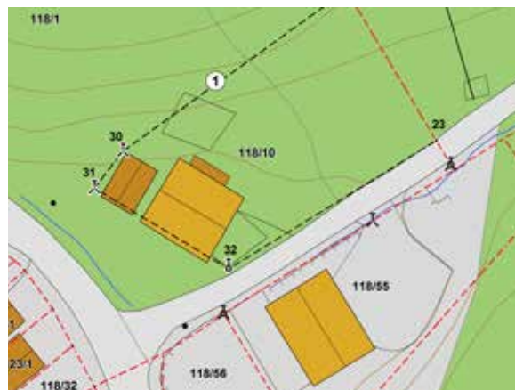
Kart er et viktig hjelpemiddel i jordskifteretten.