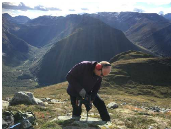
Grensemerking i Grøvdalen, høsten 2016.

I 2016 avslutta vi 29 saker, herav et vegskjønn, 12 rettsfastsettende og 16 rettsendrende saker. Det kom inn 29 nye krav. Ved årsskiftet har Romsdal jordskifterett 41 foreliggende saker til behandling. I tillegg behandler vi tre saker for Sunnmøre jordskifterett.