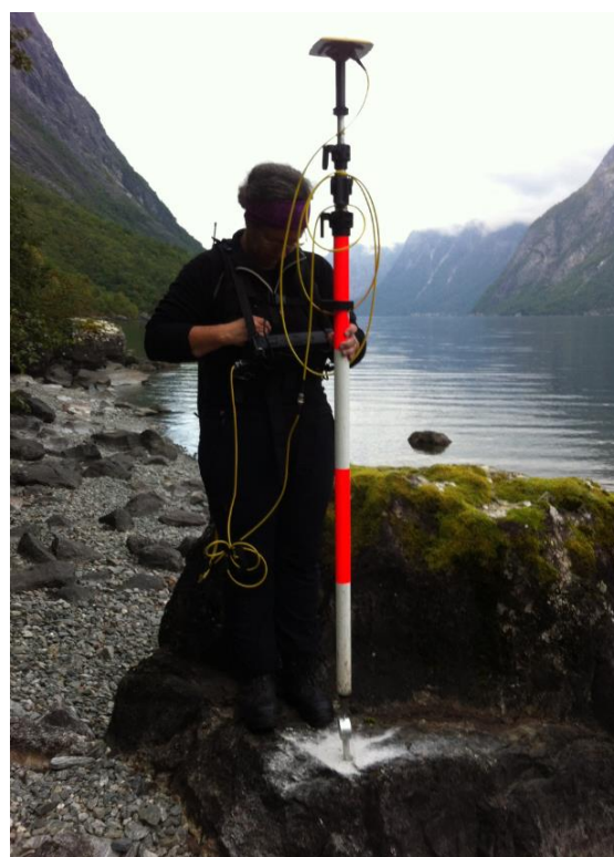
Innmåling av vernegrense i Eikesdalen

Fram til august 2016 var det sju ansatte ved Romsdal jordskifterett. På grunn av ABE-reformen blir bemanninga redusert til fem ansatte fra 2018. Med redusert bemanning blir det vanskelig å nå de sentrale måltall og ventetida forventes dessverre å øke.