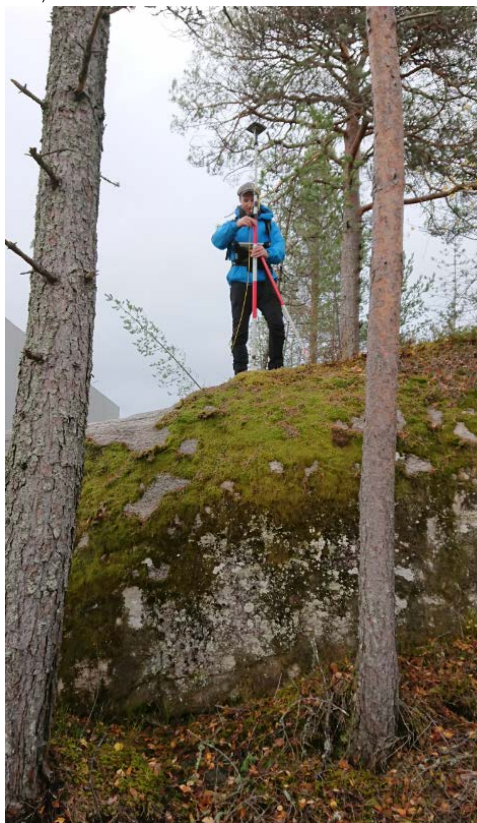
Måleoppdrag for nytilsatt jordskiftedommerfullmektig

Jordskifteretten kan også holde skjønn etter andre lover enn jordskifteloven blant annet om private veger, gjerdeskjønn, beiteskjønn og avløse eller endre servitutter.