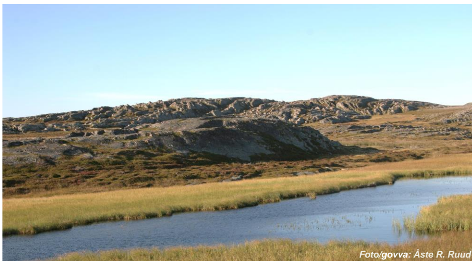
På Domen, Vardø kommune/Várggát gielda

Alimusriekti lea guoddalanásahus meahcceduopmostuolu mearrádusaide.