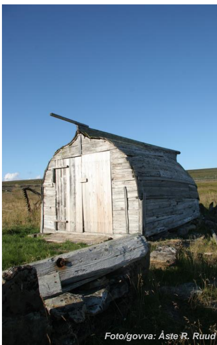
Foto/govva: Áste R. Ruud Fra Krampenes, Vadsø kommun/Čáhcesuolu gielda.

Meahcceduopmostuollu giitá maid Sis-Finnmárkku diggegotti dainna bargguin mii lea dahkkon go lei meahcceduopmostuolu gaskaboddosaš čujuhus ja vuostáiválde stevnegiid. Dasa lassin giitet maid sámegeilat gelbbolašvuođain maid addet meahcceduopmostullui. Giitosat maid Nuorta-Finnmárkku diggegoddái go veahkehedje meahcceduopmostuolu dárbbu riekteleanjaide dán oasis Finnmárkkus 2015is.