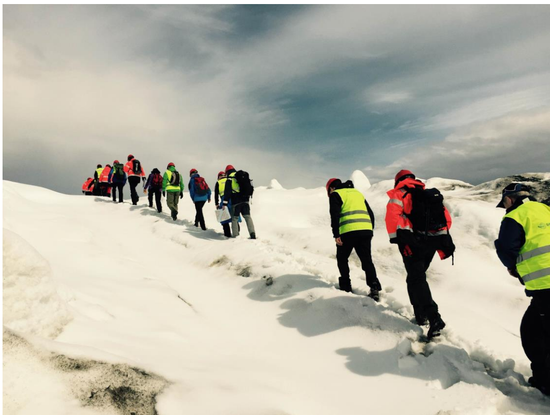
Befaring på Nabbaren, Stjernøya/ Geahčadeapmi Náppeváris, Stierdnás.

Buot guovlluid čuoččáldahttináigemearri lea mannan meattá, earret guovllu 6. Meahcceduopmostuollu sáhtta baicce meannudit áššiid mat bohtet sisa maŋŋá čuoččáldahttima áigemeari jus buot áššit seamma guovllus eai leat gárvásit meannuduovvon ja duopmostuollu gávnnahe ášši heive meannudit dan láhkái, bs. finnmárkolága § 38 nuppi lađas. Meahcceduopmostuolu mearráduosat biddjojit dađistaga Lovdatai.