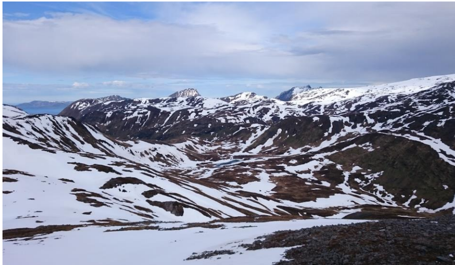
Foto/Govva: Kjersti Schanche Stjernøya, Utsikt fra Nabbaren. Várddus Náppevárís.

Utmarksdomstolen har anmodet Justis- og beredskapsdepartementet om å endre forskriften slik at partenes nødvendige utgifter forbundet med saken dekkes utenfor utmarksdomstolens budsjett. Dette har departementet etterkommet.