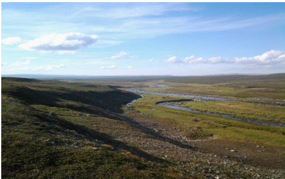
Varangerhalvøya, Álljaveadje/Øvre Flintelv, Vadsø kommune

Alimusriekti lea guoddalanásahus meahcceduopmostuolu mearrádusaide..