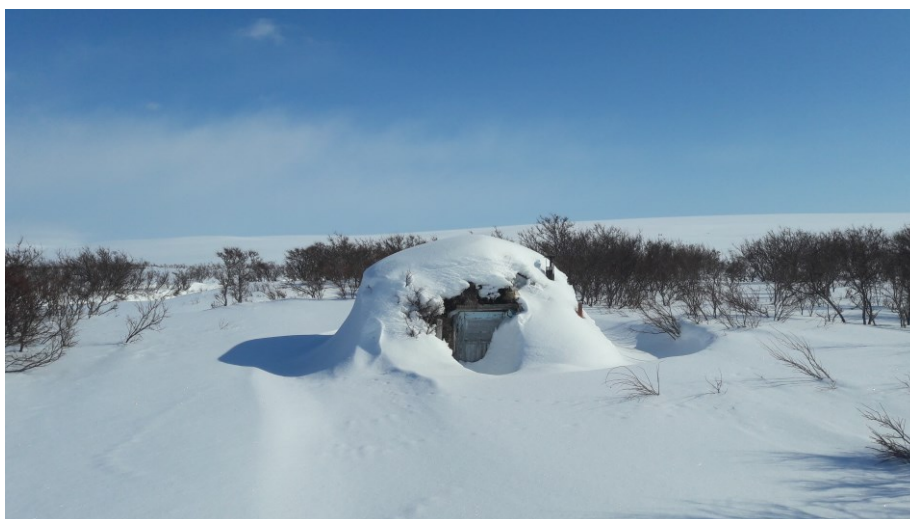
Goahti Álljeveajnjálmes, Čáhcesuolu gielddas / Gamme i Øvre Flintelvmunningen, Vadsø kommune

Meahcceduopmostuolu váldovuoruheapmi 2016s lei loahpahit buot áššiid mat bohte sisa duopmostullui. Dat lea dahkon juolluduvvon bušeahta rámaid siskkobealde. Meahcceduopmostuolu doaibmadilli lea mealgat buorránan maŋŋágo lahkaásahus § 9 nuppi láđas Finnmarkokomišuvnna ja meahcceduopmostuolu birra loahpahuvvui. Loahpaheapmi mearkkaša ahte gáibádus máksit áššegoluid mat ovddiduvvojit maŋŋá borgemánu 26.b. 2016s eai galgga máksot meahcceduopmostuolu bušeahtas, muhto galget meannuduvvot regelstivrema bokte seamma láhkai go golut friddja riekteveahkkái.