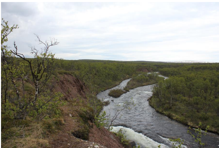
Suovvejohka, Unjárgga gielddas / Bergebyelva, Nesseby kommune.

Alimusriekti lea guoddalanásahus meahcceduopmostuolo mearrádusaide.